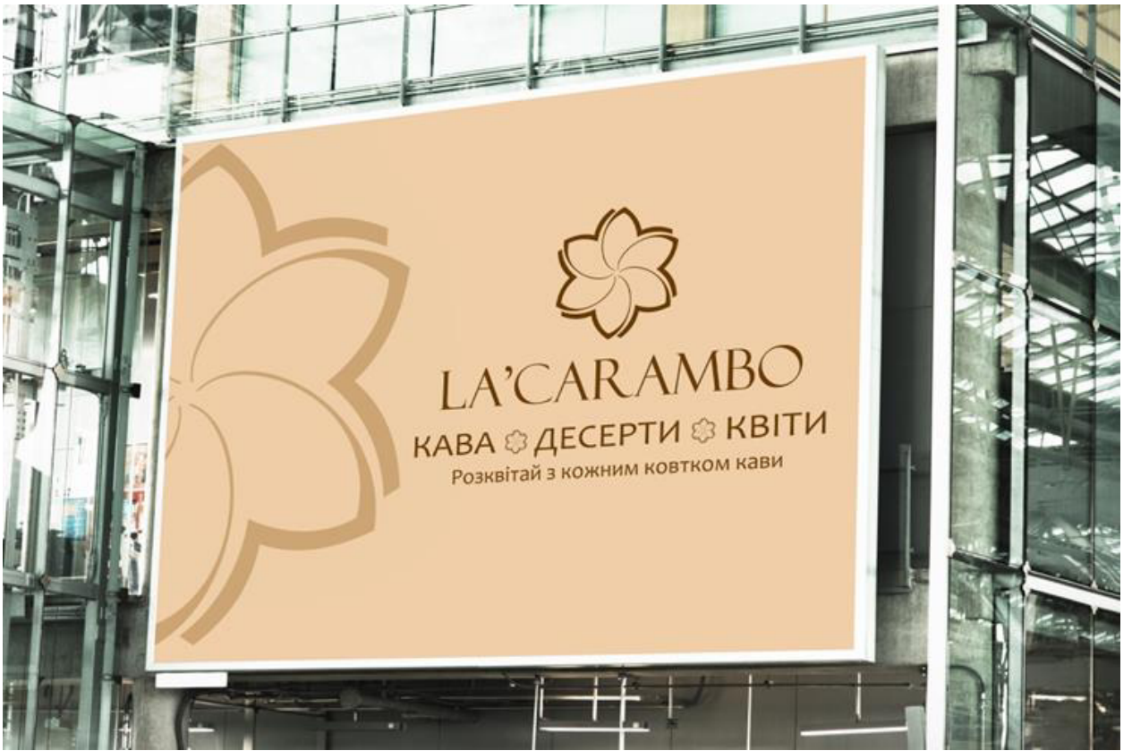
Приклад застосування фірмових елементів в зовнішній рекламі (робота ст. Табачин В.)